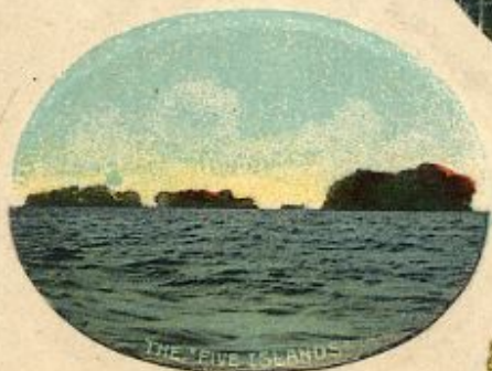
THE FIVE ISLANDS