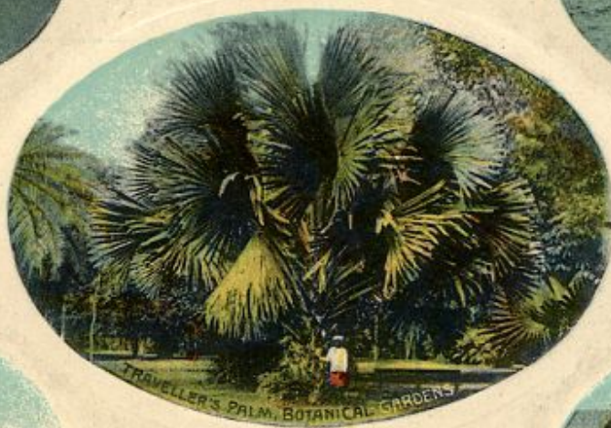
TRAVELLER'S PALM, BOTANICAL GARDENS