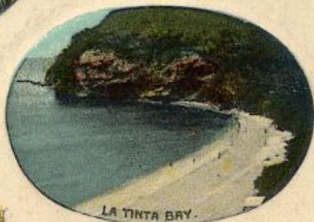
LA TINTA BAY